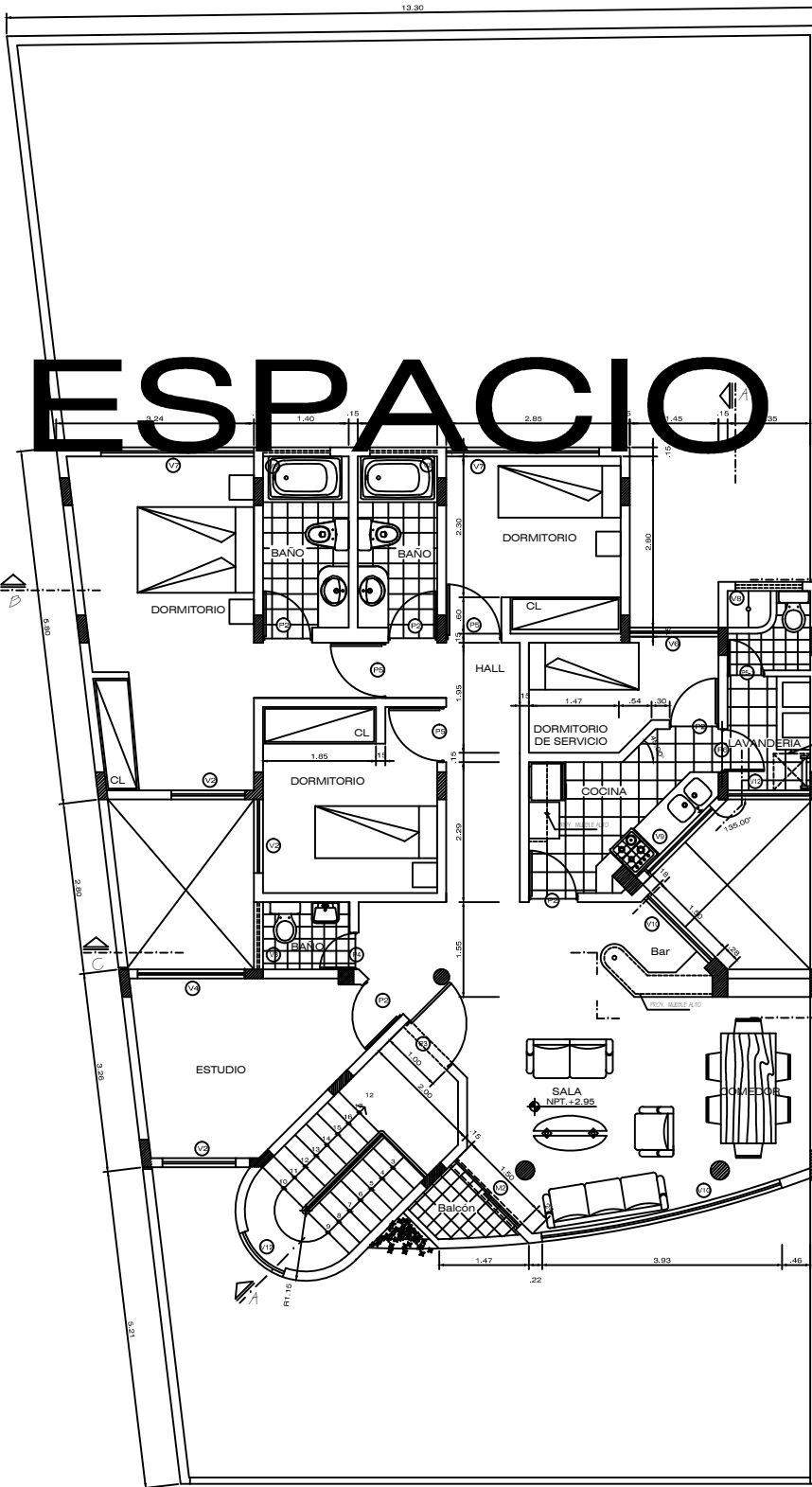
PLANTA: SEGUNDO PISO ESC. 1/50