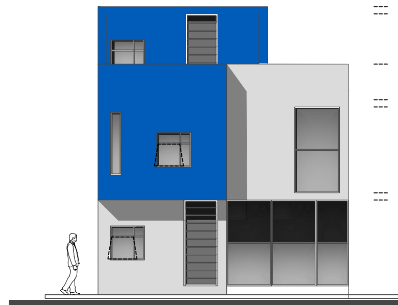
ELEVACION INTERIOR (POSTERIOR) ESC 1/50